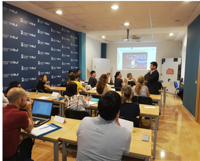
Sesión formativa en el Aula ubicada en el ámbito de actuación geográfica de la EDUSI Málaga “Perchel-Lagunillas”.

Dentro de las acciones para la dinamización y revitalización del tejido comercial de la zona de actuación de la EDUSI Málaga “Perchel-Lagunillas” están incluidas las acciones que aquí se presentan dirigidas a apoyar especialmente al pequeño comercio de cercanía en su inicio o consolidación. Lo primero que se ha realizado con los participantes ha sido un programa de consultoría empresarial (visual merchandising, escaparatismo e innovación comercial) con la finalidad de disponer de un Diagnóstico Individualizado y un Plan de Activación Comercial a medida para cada iniciativa participante. A partir del estudio de cada micropyme se realizó un trabajo de asesoramiento por parte de consultores/as expertos/as en el propio punto de venta; se hicieron formaciones grupales de apoyo al programa y se elaboró e impartió una píldora formativa en la que se abordaron los aspectos claves para una gestión estratégica de la experiencia cliente como vía de fidelización de la clientela y diferenciación de la iniciativa empresarial.