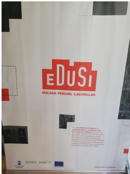
Roll-up identificativo ubicado en el Aula

Extracto formulario de inscripción en la actividad (WEB IMFE)