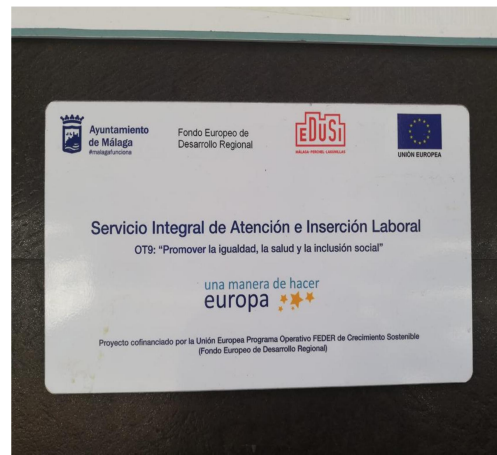
Placa identificativa del Aula