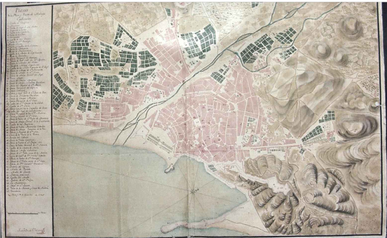
FUENTE: Málaga en 1785 (Departamento de Planeamiento y Gestión Urbanística Ayto. Málaga).